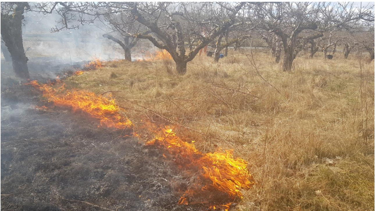
Gräsbränning i mars. Frukträderna (även yngre) tar inte skada av elden. Var dock försiktig med ihåliga träd.

Ett tredje alternativ är att låta vegetationen under träden stå orörd under hela säsongen och istället elda av gräset under tidig vår året därpå. Gräsbränningen är det mest kostnadseffektiva sättet att sköta markvegetationen och har positiva effekter för den biologiska mångfalden. Det förhindrar också uppväxten av sly. Vi har testat detta i alla våra försöksodlingar, med mycket gott resultat.