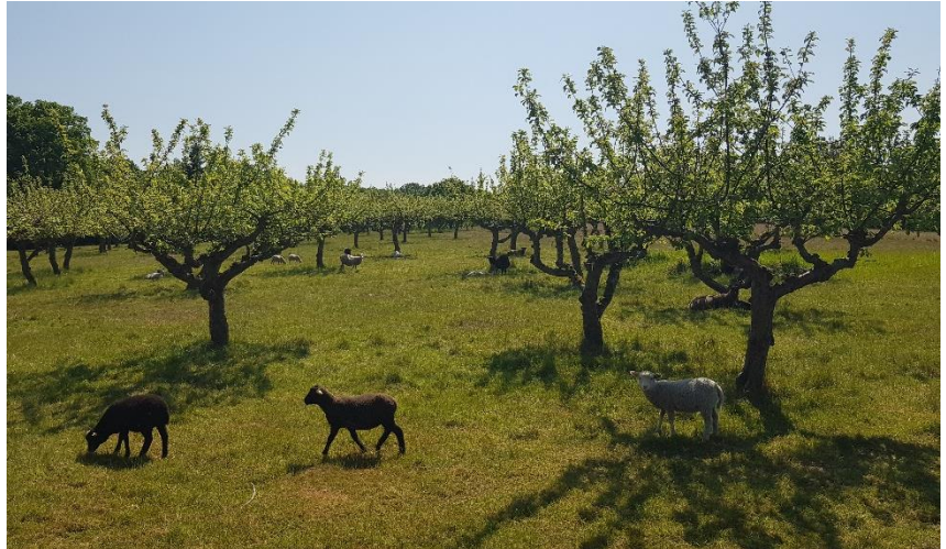
Fårbete i en äldre äppelodling. Djuren tar alla skott de kan komma åt, vilket gör att trädens kronor får bli höga.

genom att äta alla skott och blad de kan komma åt. Olika djurslag betar också olika, så det krävs en hel del kunskap och närvaro för att detta alternativ ska bli bra för både träden och marken.