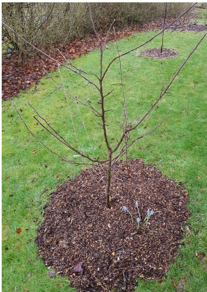
Nyplanterat äppelträd som täckts med flis. Sidogrenarna har bundits ned för att på sikt skapa en korgform.

Generellt mår nyplanterade och yngre fruktträd bra av att ha en gräsfri zon runt stammen, ju större desto bättre (gärna lika stor som droppzonen är). Gräset tar nästan upp allt regnvatten och stjälar dessutom en stor del av näringen. Den gräsfria zonen kan med fördel täckas med någon form av täckmaterial för att hejda avdunstning och gynna mikrolivet. Man kan t.ex. använda löv eller lövkompost, flis eller bark. Eftersom de flesta träd mår bra av ett relativt högt pH värde så bör man helst undvika flis eller bark av barrträd, men det går förstås också att tillföra kalk.