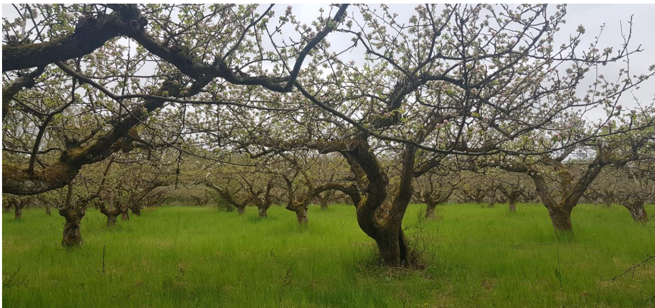
En av Österlens äldsta odlingar från 1950-talet. Träden är planterade med ca 6 meters avstånd.

Med begreppet äldre odling menar vi odlingar som planterades i början av 80-talet eller tidigare. Men det är inte bara trädens ålder som gjort att vi bedömt odlingen som äldre, utan snarare odlingens karaktär. Till skillnad från moderna spaljeodlingar så står träden här glest och har starkväxande grundstammar, vilket innebär att träden blir relativt stora och vidkroniga. Det mest karakteristiska är dock formen – huvudstammen har tidigt sågats av och träden har fått en så kallad korgform.